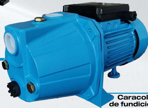
Caracol de fundición

Ideales para bombear grandes caudales de agua en poco tiempo. Una gran alternativa para llevar agua a tanques elevados o riego por aspersión en jardines. Su particular diseño permite aspirar agua aún en presencia de aire mezclado con el líquido.